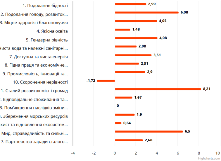
Прогрес у досягненні Цілей сталого розвитку по регіону (undefined)