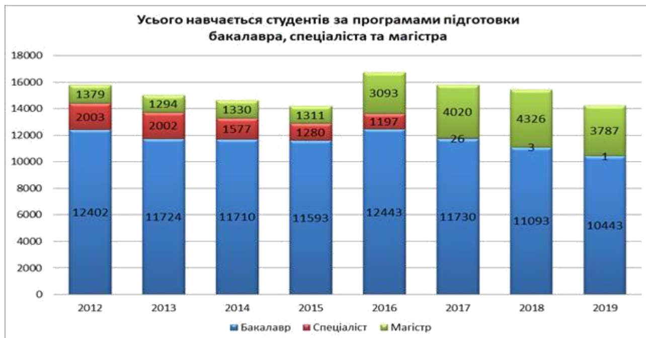
Таблиця 24 (рух контингенту студентів)