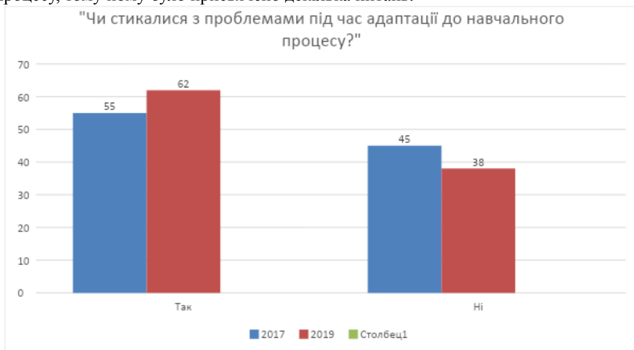
Рисунок 2. Розподіл відповідей на питання: «Чи стикалися ви з певними проблемами під час адаптації до навчального процесу?»

Важливим питанням буття першокурсників є адаптація до навчального процесу, тому йому було присвячено декілька питань.