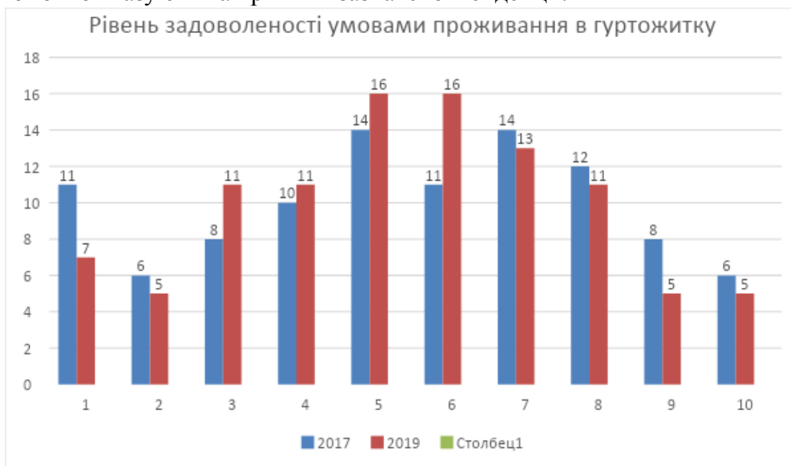
Рисунок 6. Рівень задоволеності умовами проживання в гуртожитку (за

Як видно з рисунку 5, кількість проживаючих в гуртожитку першокурсників скоротилась на 19 %. Відповіді на наступне питання, присвячене вивченню рівня задоволеності умовами проживання в гуртожитку, красномовно вказують на причини зазначеної тенденції.