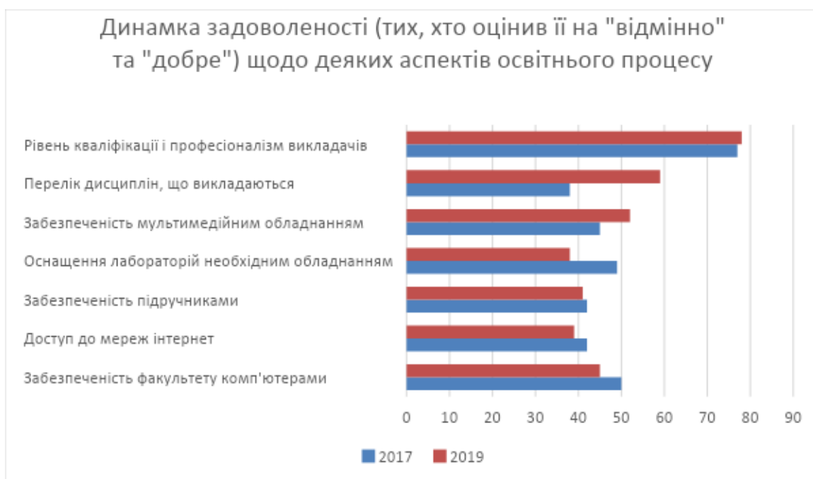
Рисунок 3. Динаміка задоволеності деякими аспектами освітнього процесу (у % до загальної кількості респондентів, порівняння двох етапів дослідження)

Враховуючи важливість бачення напрямів підвищення якості освітнього процесу, першокурсникам було задане відповідне питання.