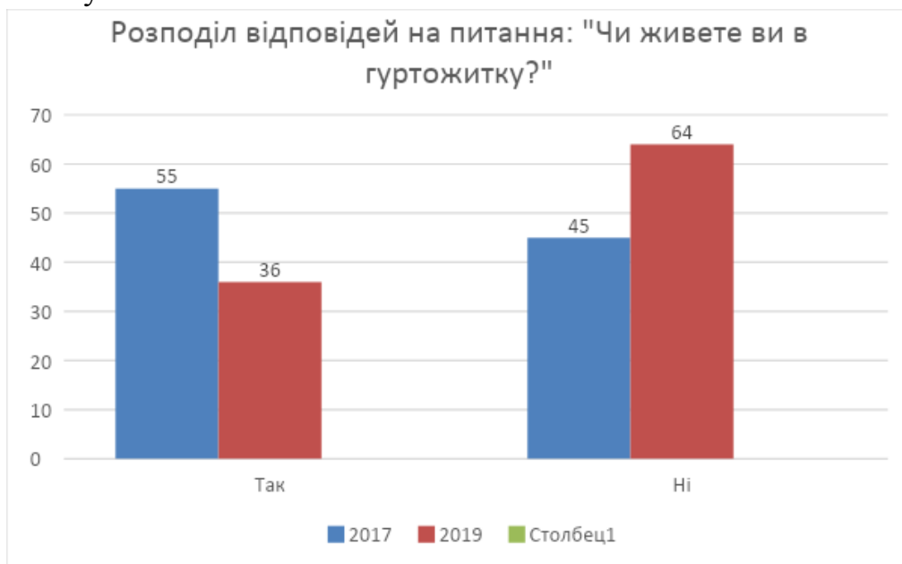
Рисунок 5. Розподіл відповідей на питання: «Чи живете ви в гуртожитку?» (у % до загальної кількості респондентів)

Останній блок анкети стосувався задоволеності побутовими умовами в гуртожитку.