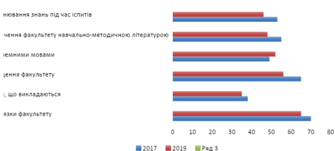
Рисунок 4. Найважливіші заходи для підвищення якості освітнього процесу (у % до загальної кількості респондентів)

Як бачимо з рис. 4, важливість всіх запропонованих заходів за два роки дослідження зростає, причому серед найважливіших заходів – розширення